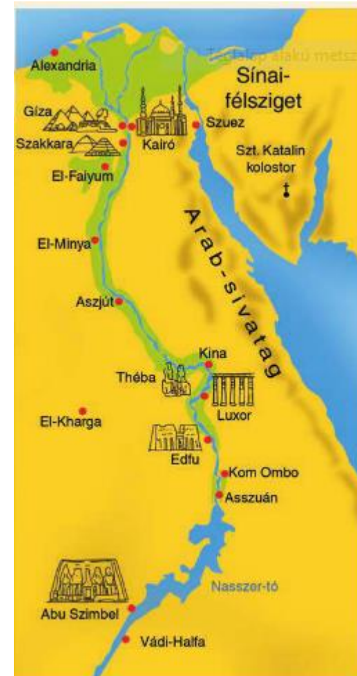
5.8. ábra. Egyiptom főbb nevezetességei